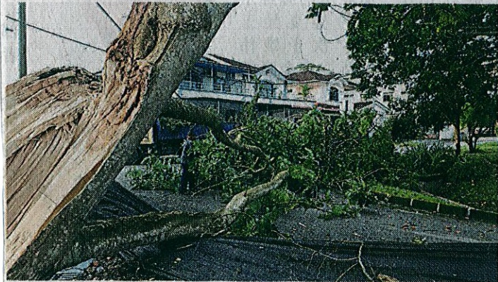
▲市议会人员协助清理沙威二路的倒树。

(古来6日讯)今午的一场暴风雨横扫士乃及沙威一带，导致多条路段旁的树枝被吹倒，多家屋瓦、电视天线、广告牌被刮倒。